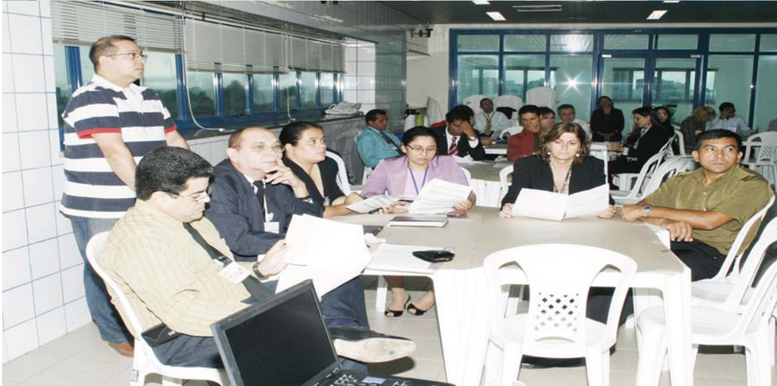
Oficinas para definição das estratégias e planos