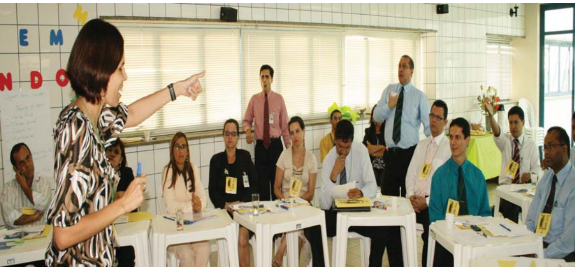
Curso de Capacitação em Planejamento Estratégico pela ENAP