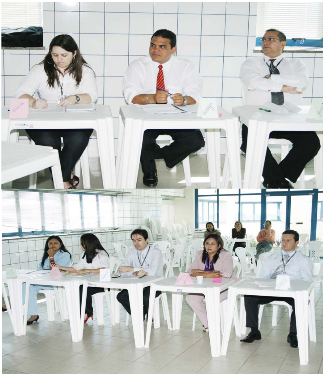
Oficinas de Revisão do Planejamento Estratégico

A cultura do planejamento ainda não está consolidada por todos os integrantes do Regional.