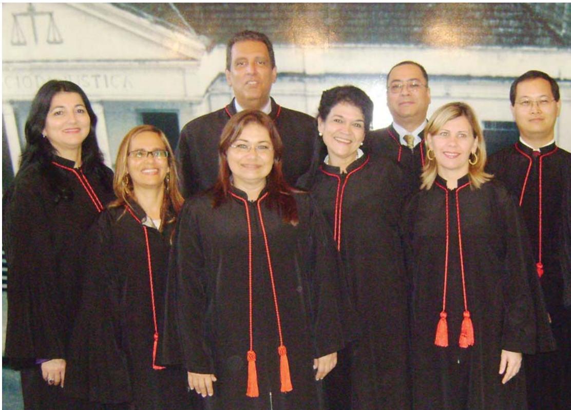
Composição atual do Tribunal Pleno