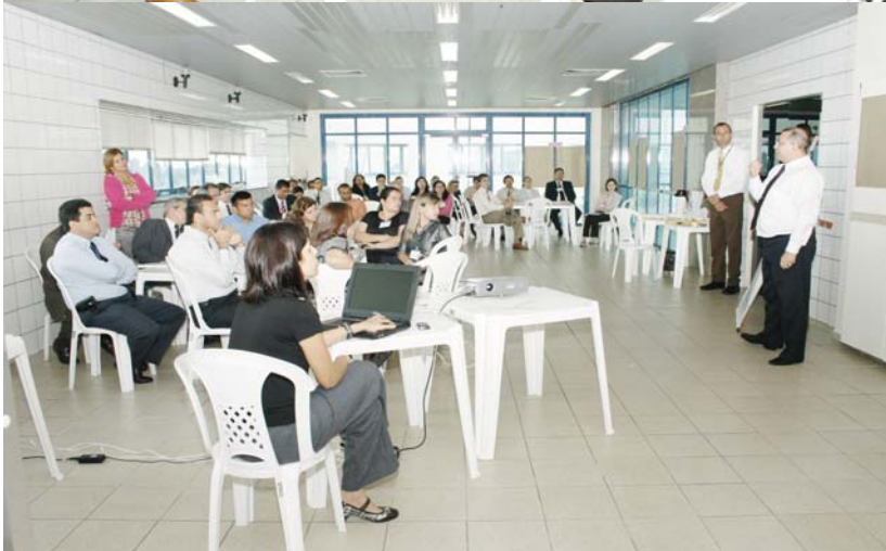
Oficinas de Revisão do Planejamento Estratégico